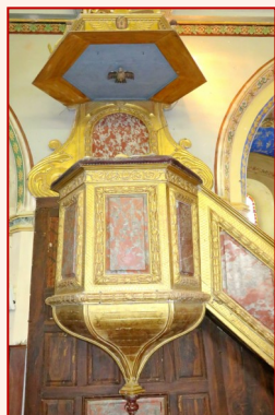
Chaire du XVII e

De bois doré, elle est ornée de panneaux de marbre rouge.