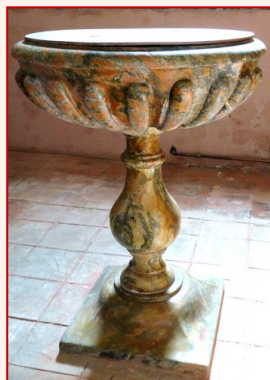
Bénitier du XVIII e

De bois doré, elle est ornée de panneaux de marbre rouge.